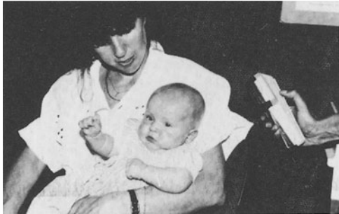
Screening-Hörprüfung beim Kleinkind