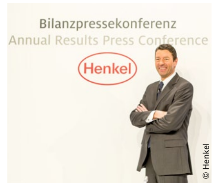
Kasper Rorsted, Vorsitzender des Henkel-Vorstands: „Wir erwarten für das Geschäftsjahr 2013 ein organisches Umsatzwachstum zwischen 3 und 5 Prozent.“

„Wir erwarten für das Geschäftsjahr 2013 ein organisches Umsatzwachstum zwischen 3 und 5 Prozent. Für die bereinigte EBIT-Marge rechnen wir mit einem Anstieg auf etwa 14,5 Prozent und für das bereinigte Ergebnis je Vorzugsaktie mit einem Zuwachs von etwa 10 Prozent“, sagte Kasper Rorsted,