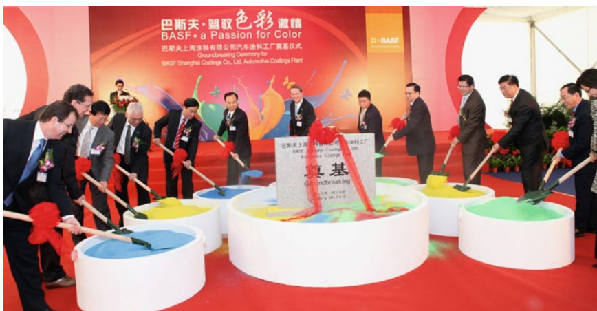
Erster Spatenstich für den Bau der neuen Anlage für Fahrzeugserienlacke von BASF Shanghai Coatings in Shanghai