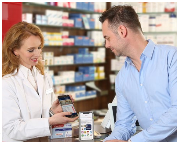
Die App zur Therapiebegleitung enthält viele hilfreiche Informationen, Videos und Erinnerungsfunktion

set und der Canesten® Extra Creme gering: Innerhalb von 14 Tagen lassen sich mit der Harnstoff- und Bifonazol-haltigen Salbe aus dem Nagelset die infizierten Nagelbereiche entfernen. Danach erfolgt eine vierwöchige Weiterbehandlung mit der Canesten® Extra Bifonazol Creme zur Bekämpfung der Resterreger im Nagelbett.