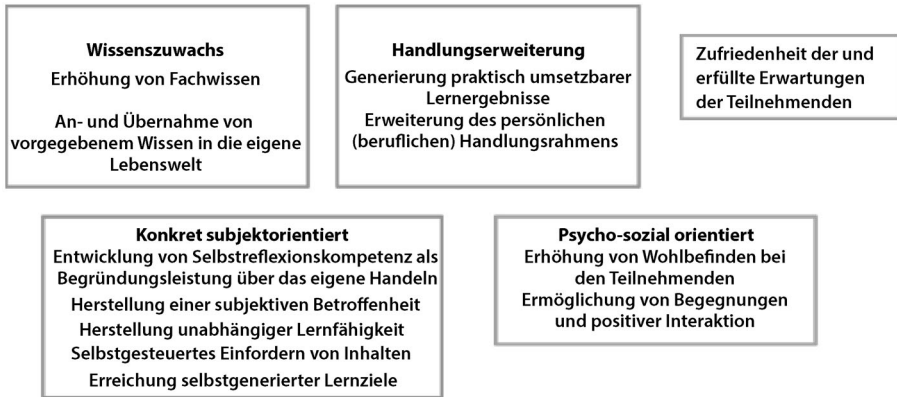
Abb. 3 Absichten und Lehrziele (eigene Darstellung)

sein muss. Neben dem Vergnügen an den Lernprozessen und der aktiven Mitarbeit werden gegenseitige Akzeptanz und inhaltliche Offenheit als Voraussetzungen für den Rahmen von Lehr-Lernprozessen genannt (vgl. I7, Z. 989 ff.).