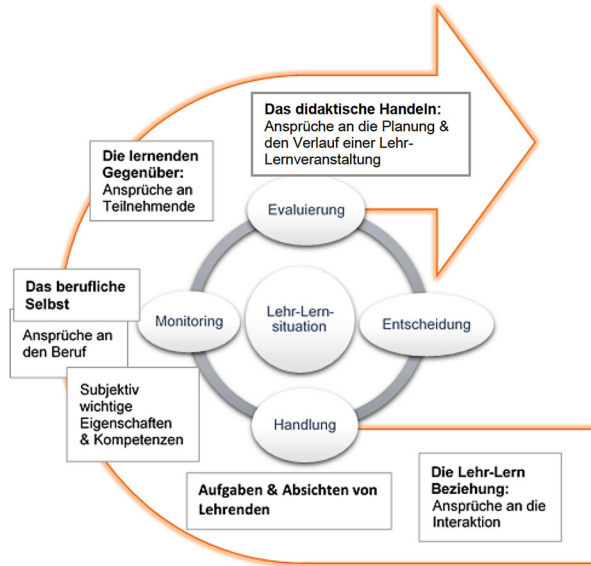
Abb. 2 Die Parameter als Teil des Toleranzkorridors (eigene Darstellung)

Weil dass es gut läuft, das ist für mich an und für sich die Regel oder ... zumindest meine Wahrnehmung sagt mir das, und dann bin ich froh und denke an und für sich weniger drüber nach oder ich denke nicht unbedingt dann drüber nach was hab ich da gut gemacht ... oder warum ist es gut gelaufen weil das ist an und für sich der Normalzustand ist (I6, Z. 21–26, S. 1 f.).