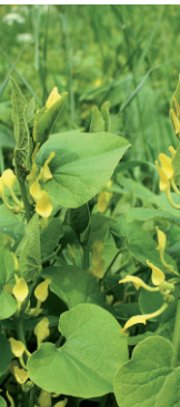
In Osterluzei findet sich das krebserregende Alkaloid Aristolochiasäure (A-Säure).