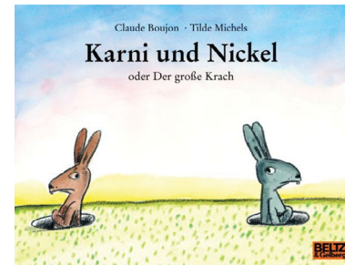
Claude Boujon, Tilde Michels Karni und Nickel oder der große Krach Ab 3 Jahren, Beltz & Goldberg, 6,50 €

Streit sich wie eine Spirale immer höher dreht. Für Geschwisterkinder könnte das ein interessantes Buch sein, das auch wunderbar nachgespielt werden kann.