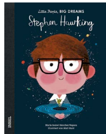
Von María Isabel Sánchez Vegara Little People, Big Dreams Ab 3 Jahren, Insel Verlag, 13,95 €

Warum diese Bücher: Sehr unkompliziert, altersgerecht und simpel, bringt diese Buchreihe den Kindern berühmte Persönlichkeiten nahe. Schon der Titel sagt, dass auch kleine Menschen große Träume haben und diese auch verwirklichen können. Mit vielen Bildern und wenig Text ist die jeweilige Biografie für jedes Kind zugänglich. Diese Bücher sind auf besondere Weise lehrreich, sie können inspirieren, Leidenschaften wecken und dazu ermutigen, eigene Wege zu gehen.