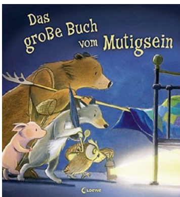
Jane Chapman und Tim Warnes Das große Buch vom Mutigsein Ab 3 Jahren, Loewe-Verlag, 12,62 €

Warum dieses Buch: Unheimliche Geräusche, Schatten an der Wand, Angst vor der Dunkelheit und Sorge bei Gewitter begleiten jedes Kind hin und wieder. In diesen drei liebevoll illustrierten Bilderbuchgeschichten geht es um „Angstfrösche“ und „Mutbären“. Jeder sucht Hilfe und bekommt sie auf eine andere Weise. Beim Vorlesen entsteht ein bisschen Spannung, die sich am Ende durch originelle Wendungen in befreitem Lachen löst.