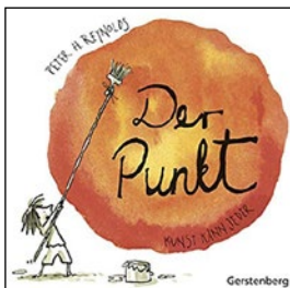
Reter H. Reynolds Der Punkt – Kunst kann jeder Ab 5 Jahren Gerstenberg 9,95 €

Warum dieses Buch? Wie einfach es sein kann, Kreativität hervorzulocken und zu fördern, zeigt dieses kleine Buch. Kinder in ihrem täglichen Tun zu stärken, wertzuschätzen und Mut zu machen, ist die Aufgabe von Eltern, Erziehern und Lehrern. Diesem Büchlein gelingt dies ohne den erhobenen pädagogischen Zeigefinger. Mit Zeichnungen, die Kraft ausstrahlen und Gefühle zeigen, ist es ein Vergnügen für Kleine, Mittelkleine und Große die Seiten umzublättern. Jeder kann ein Künstler sein und es ist völlig egal, was man aufs Papier bringt – es kommt einfach darauf an es zu tun.