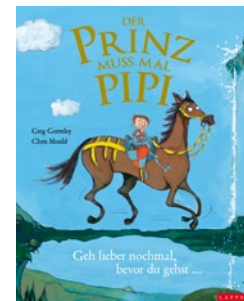
Greg Gormley, Chris Mould (Illustrationen) Der Prinz muss mal Pipi Ab 3 Jahren Lappan 12,99 €

zelnen Szenen sind voller Situationskomik und manches Kind wird nach der Lektüre mit Begeisterung zur Toilette gehen.