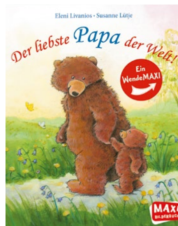
Eleni Livianos und Susanne Lütje Der liebste Papa der Welt Ab 2 Jahren Oetinger 6 €

Warum dieses Buch? Ein Vorlesebuch mit ansprechenden Bildern, in dem es mal nur um die Papas geht. Ein Vater, der sich Zeit nimmt, sein Kind beschützt, es trägt, wenn es nötig ist, mit ihm spielt, Spaß und Unsinn macht und der warme Rückenwind im Leben seines Kindes ist, ist der beste Papa der Welt. Jedem Kind wünsche ich einen solchen Vater und den Vätern viel Freude, wenn sie ihre Kinder durchs Leben begleiten.