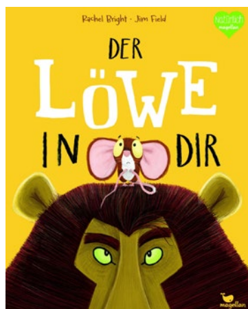
Rachel Bright und Jim Field Der Löwe in Dir Ab 3 Jahren Magellan 14 €

Warum dieses Buch? Mit einem Zitat aus dem Buch ist alles gesagt: „So fanden die beiden schließlich heraus: Jeder von uns ist mal Löwe, mal Maus.“ Sehr ausdrucksstarke Bilder lassen mehr entdecken als zu lesen ist. Die Entwicklung der Maus, die Darstellung ihrer Gedanken und die Überwindung ihrer Ängste geben viel Raum für Gespräche. Für alle Kinder und Eltern, die mal den Löwen in sich entdecken wollen.