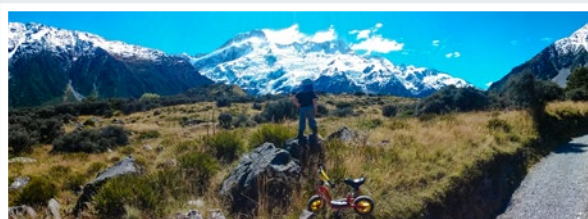
In den Neuseeländischen Alpen von Hendrik Friedel, Weyhe