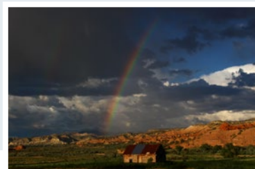
Kodachrome Basin State Park, Utah, USA

Vielen Dank an alle Teilnehmer und herzlichen Glückwunsch an die Gewinner.