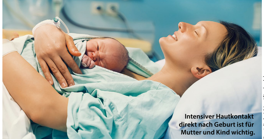
Intensiver Hautkontakt direkt nach Geburt ist für Mutter und Kind wichtig.

Das Wissenschaftlerteam randomisierte dafür 40 Schwangere in zwei Gruppen: In der „skin-to-skin contact“ (SSC)-Gruppe wurde unmittelbar nach Sectio und Untersuchung des Neugeborenen Bonding über mindestens eine Stunde ermöglicht. In der Kontrollgruppe wurde standardmäßig vorgefahren, der Kontakt fand erst nach Verlassen des Aufwachraums statt. Dokumentiert wurden neben der Hämoglobinkonzentration (Hb) im Plasma auch die Uteruskontrak-