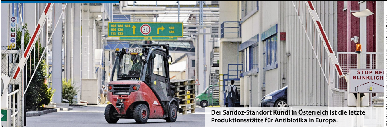
Der Sandoz-Standort Kundl in Österreich ist die letzte Produktionsstätte für Antibiotika in Europa.