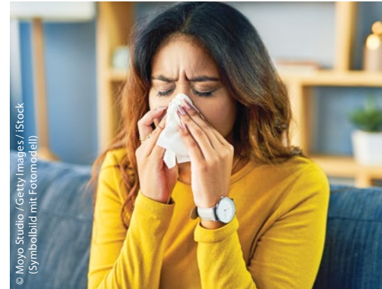
© Moyo Studio / Getty Images / Stock (Symbolbild mit Fotomodell)

In einer Stanzbiopsieprobe der entzündeten Haut, zwei Tage nach dem Abstrichentnommen, konnten die Baseler Ärzte jedoch Coronaviren nachweisen. Ein Antikörpertest sechs Wochen später war dagegen wieder negativ. Die Autoren des Fallreports betonen, dass es sich hierbei um wichtige Erkenntnisse handle, da er die Mängel der derzeit verfügbaren Testmethoden auf SARS-CoV-2-Infektionen hervorhebe. Während Sensitivität und Spezifität der aktuell verfügbaren PCR- und Serologietests zwar hoch