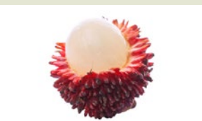
Eine Pulasan-Frucht ( Nephelium mutabile ) mit kreisrundem Haarausfall.