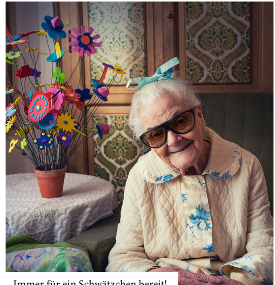
Immer für ein Schwätzchen bereit!

Inzwischen betrat auch die Pflegerin das Zimmer und sagte lächelnd: „Die Patientin im Nebenzimmer ist gemeint.“ Also verabschiedete ich mich wieder von der netten Dame. Als ich die richtige Patientin untersucht hatte und auf dem Rückweg wieder durch