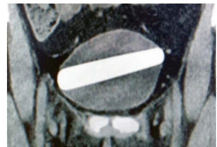
CT-Scan der Blase, in der Breite durch den Fremdkörper gänzlich ausgefüllt.

Dem urochirurgischen Team gelang dabei ein Weltrekord: Noch nie zuvor konnte ein Gegenstand mit einer solchen Breite über eine Harnröhre extrahiert werden. Bisher war man davon ausgegangen, dass die weibliche Urethra auf bis zu