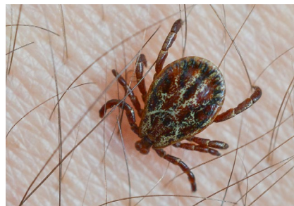
Der Stich einer Zecke kann ein Alpha-Gal-Syndrom auslösen.

alpha-1,3-Galaktose (Alpha-Gal). Bei entsprechender unklarer Symptomatik und möglicher Zeckenexposition raten die Experten daher zum IgE-Test, unabhängig davon, ob zusätzlich Hautzeichen wie Urtikaria oder Angioödem vorliegen.