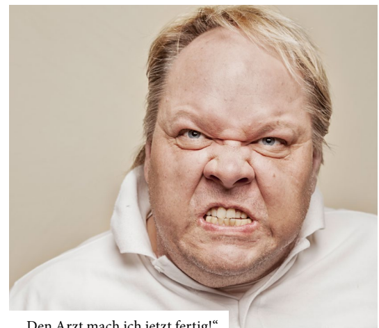
„Den Arzt mach ich jetzt fertig!“