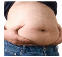
Gewichtiger Risikofaktor auch für SARS-CoV-2-Infizierte.

Quelle: Phelan D et al. JAMA Cardiol 2020; https://doi.org/10.1001/jamacardio.2020.2136