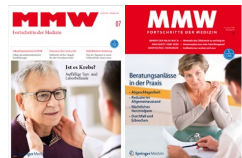
Die MMW im neuen und alten Look.

Ganz so hatten wir uns das eigentlich nicht vorgestellt: In diesen Wochen findet der lange vorbereitete MMW-Relaunch statt – und die Redakteure und Layouter müssen aus dem Home Office arbeiten. Grafisch ruckelt deshalb vieles noch ein wenig – Details sind Ihnen vielleicht sogar schon einmal aufgefallen. Aber insgesamt sind wir mit unserer neuen Linie sehr zufrieden. Die weiße Titelseite ist frisch, die neue Themen- und Autorensseite (bitte einmal umblättern) führt gut ins Heft, die insgesamt deutlich hellere Gestaltung ist für das Auge angenehm. Wir freuen uns auf Ihr Feedback: redaktion.mmw@springer.com