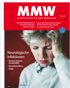
Die MMW im neuen und alten Look.