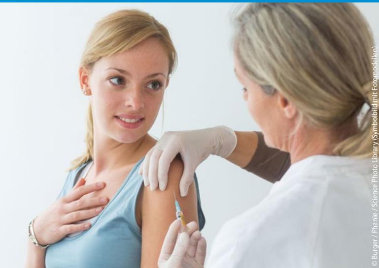
(Symbolbild mit Fotomodellen)

Von der HPV-Impfung für jugendliche bis zur neuen Zoster-Vakzine für Ältere – unser Impfschwerpunkt bringt Sie auf den aktuellen Stand.