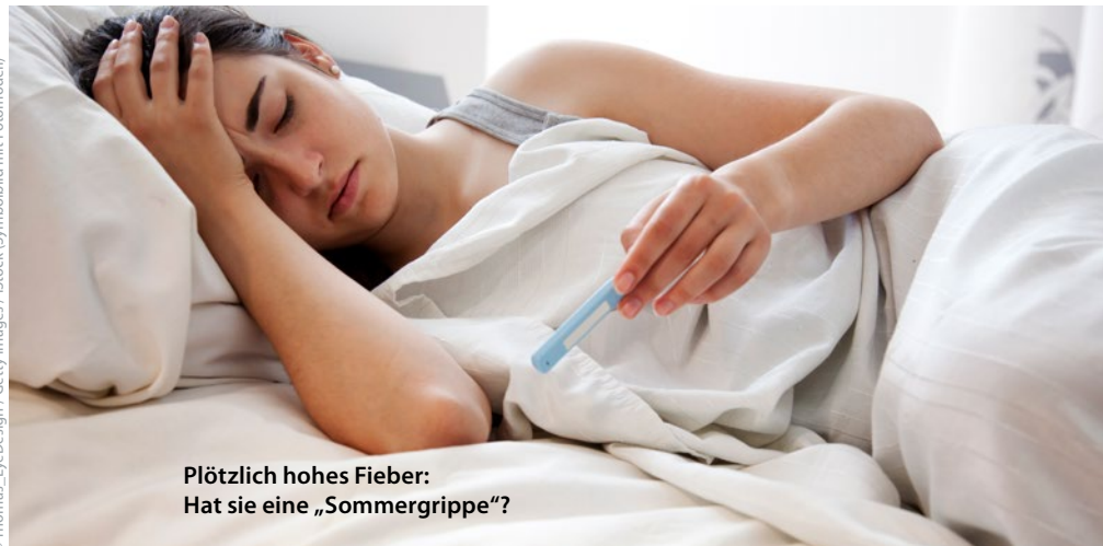
Plötzlich hohes Fieber: Hat sie eine „Sommergrippe“?

Die Epidemiologie und Saisonalität von respiratorischen Erkrankungen zeigen zwar für etliche Erreger eine eindeutige Häufung in der kalten Jahreszeit, aber nicht für alle. Hinzu kommen Infektionen, die durch trocken-warme Witterungsbedingungen eher gefördert werden. Auch Erreger, die nicht primär den