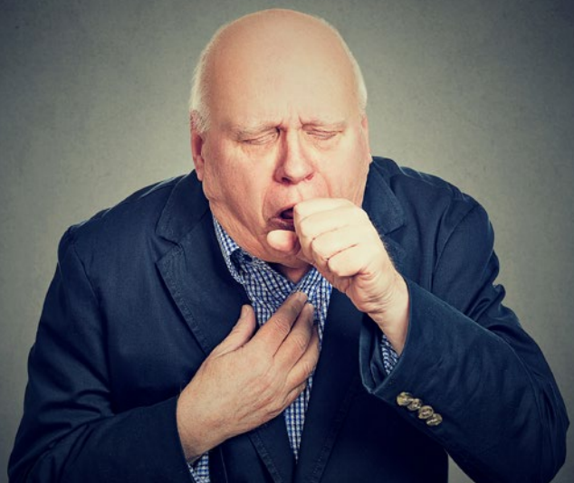
(Symbolbild mit Fotomodell)

Die COPD scheint früher zu beginnen als bisher angenommen. Welche Konsequenzen hat das für die Praxis? Und was tun bei schwerer COPD?