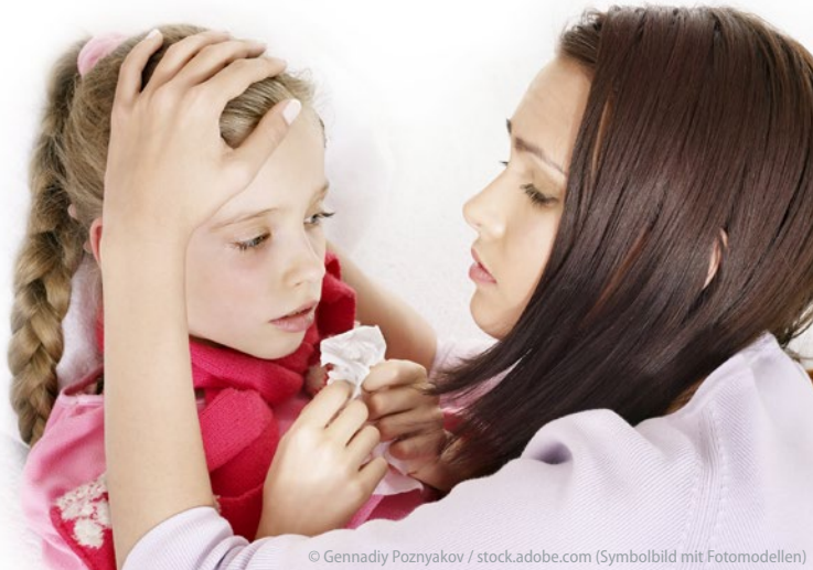
(Symbolbild mit Fotomodellen)

Wenn Kinder immer wieder mit wechselnden Symptomen vorgestellt werden, sollte man hellhörig werden. Ist die scheinbar fürsorgliche Mutter schuld?