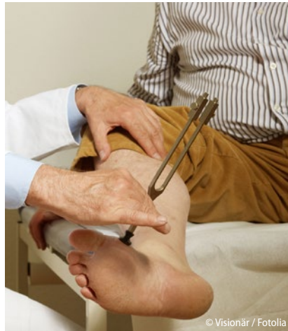
Prüfung der Vibrationswahrnehmung ...

Bei der Spezifität schnitten allerdings Knöchelreflex und Vibrationswahrnehmung mit Werten von 62% und 77% am schlechtesten ab. Die höchste Spezifität zeigten Propriozeption bzw. die Wahrnehmung von leichten Berührungen