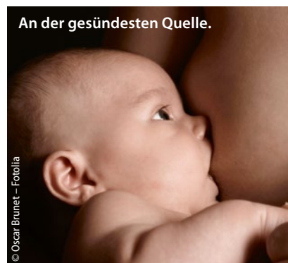
An der gesündesten Quelle.

▪ Madan JC et al. JAMA Pediatr 2016, online 11. Januar