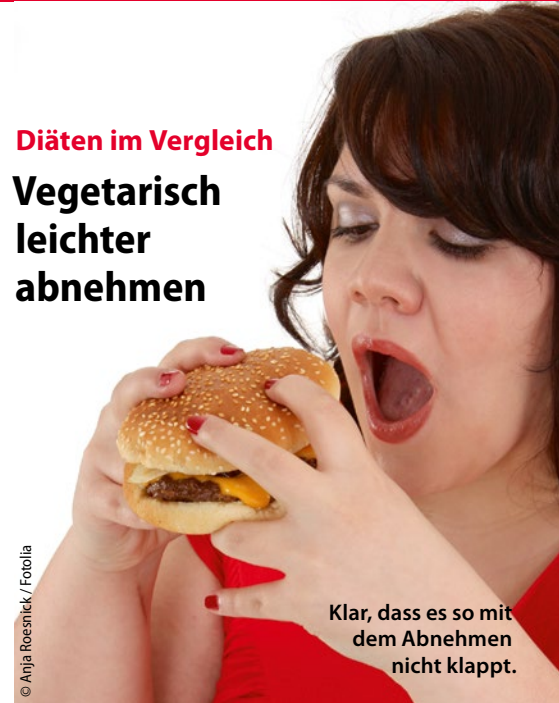
Klar, dass es so mit dem Abnehmen nicht klappt.

— Mit Verzicht auf Fleisch und Fisch schmelzen überflüssige Pfunde leichter. Noch wirksamer scheint eine ausschließlich pflanzliche Ernährung zu sein.