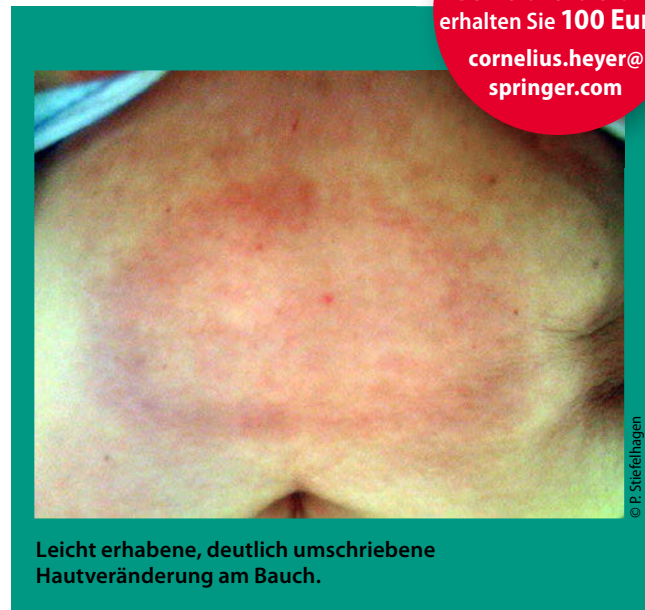
Leicht erhabene, deutlich umschriebene Hautveränderung am Bauch.