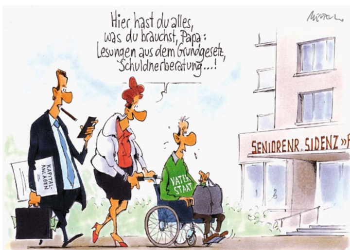
Vater Staat als Pflegefall? Um echte geriatrische Patienten geht es ab S. 46.

CMAJ 2012; online 17. September. DOI:10.1503/cmaj.120876