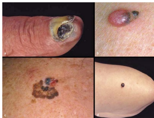
(a) Subunguales, (b) amelanotisches, (c) superfiziell-spreitendes und (d) noduläres Melanom.

Die 5-Jahres-Überlebensraten sind beim malignen Melanom relativ hoch. Die Analyse der Krebsregister von elf Bundesländern zeigt zwischen 2002 und 2006 insgesamt wenig Veränderungen. Allerdings hatten in sämtlichen Subgruppen die Frauen eine bessere Prognose als die Männer. Letztere tendierten im Zeitverlauf zu einer höheren Sterblichkeit. Bei den Frauen ergab sich zwischen 2002 und 2006 ein Anstieg beim 5-Jahres-Überleben