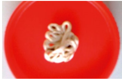
Das Corpus delicti: der operativ entfernte Knochenzement.

Eine Woche nach dem Eingriff klagte der Patient über plötzlich einsetzende, atemabhängige, linksthorakale Schmerzen und Dyspnoe. Das EKG zeigte einen inkompletten Rechtsschenkelblock als möglichen Hinweis auf eine rechtsventrikuläre Belastung. Computertomogra-