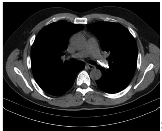
Computertomografie: Knochenzement im Hauptstamm der A. pulmonalis links.