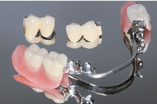
40// So wählen Sie den Zahnersatz mit dem richtigen Halt