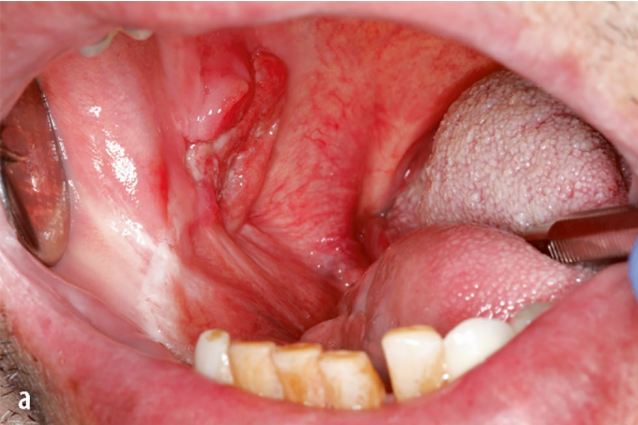
30// Harmloser Befund oder bösartiger Krebs?