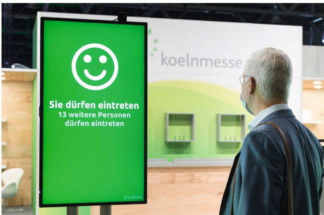
16// Mit ausgeklügeltem Hygienekonzept sicher zur Messe.