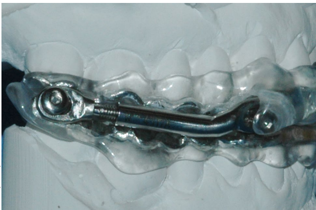
10// Mit Schienen gegen das Schnarchen – aber gewusst wie!