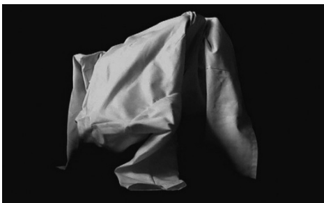
Afbeelding 2. Beeld uit serie 'Hybrids' (2008).

Ondanks deze complexe ethische vragen, of misschien wel dankzij, ben ik overtuigd van de urgentie de discussie over de (bio)medische thema's te stimuleren. Hieraan kunnen kunstenaars een belangrijke bijdrage leveren: als bruggenbouwers kunnen ze op verschillende manieren tussen de wetenschap en het publiek opereren, en zo de klinische en persoonlijke 'landschappen' ineen laten strengen.