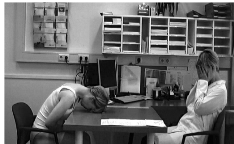
Afbeelding 1. Second opinion (2008).

Het is geen toeval dat de camera en mijn lichaam mijn belangrijkste 'onderzoeksinstrumenten' zijn: gezien mijn opleiding zijn ze voor mij de logische instrumenten om de wereld om me heen te verkennen. Bovendien staan het lichaam en camera ook centraal in de medische wereld. De echtheid van video fascineert me, in combinatie met de mooie 'leugens' die de camera kan creëren binnen een totaal