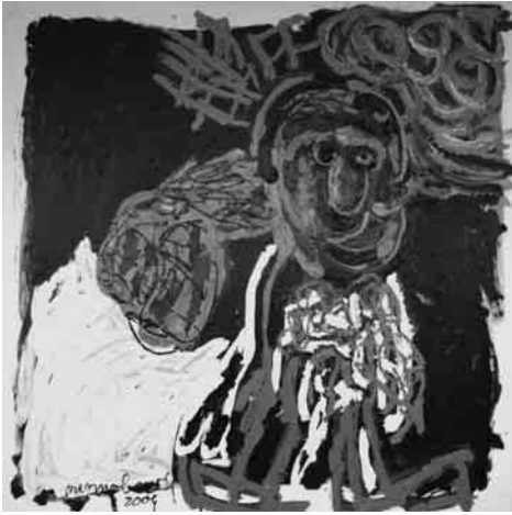
Afbeelding 1. Mexican Woman , 180x180 cm, olie- verf op linnendoek, 2009 – Menno Baars.

doet en wat je gaat doen. Het blijft natuurlijk een schizoïde bezigheid, want er is altijd iemand die kijkt wat je doet en hoe je het doet. Ik onderzoek niet de sociale en culturele ideeën van deze tijd. Ik vind dat een kunstwerk genot moet verschaffen en emoties moet oproepen. Net zoals ik deze ervaar wanneer ik een patiënt 'er doorheen sleep'.