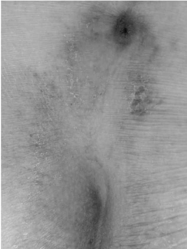
Fig. 1 Suppuration située au niveau de la partie haute du sillon interfessier