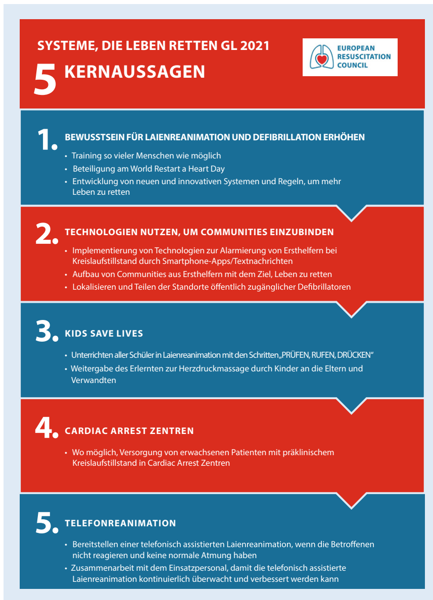
Abb. 1 ▲ Infografik Zusammenfassung lebensrettende Systeme

Das „Systems Saving Lives“-Konzept betont die Verbindung zwischen Bevölkerung und Rettungsdienst (z. B. KIDS SAVE LIVES) und soll in jedem europäischen Land implementiert werden. Lebensrettende Systeme reicht vom jungen Schüler, der in der Schule HLW lernt, über einen Bürger, der über sein Mobiltelefon einen Kreislaufstillstandsalarm erhält und bereit ist, die HLW zu starten und vor Ort einen automatisierten externen Defibrillator (AED) zu verwenden, bis zum Rettungsdienstteam, das die ALS-Behandlung fortsetzt, um den Patienten für die Nachbehandlung in einem Hochleistungs Krankenhaus zu stabilisie-