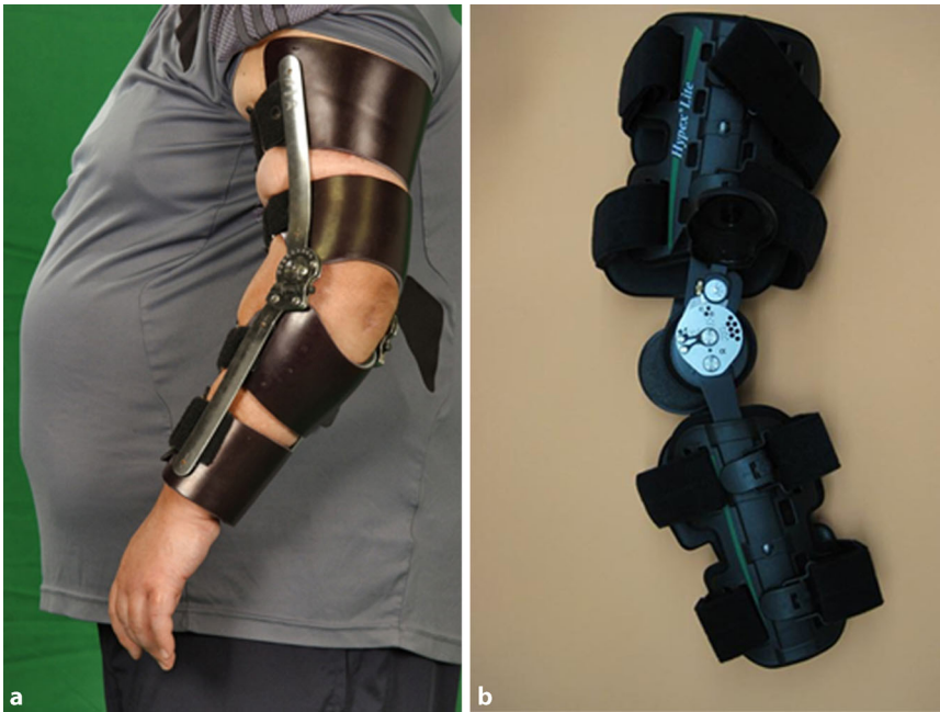
Abb. 5 ▲ Ellenbogenorthesen. a Individuell angefertigte statisch fixierbare Ellenbogenorthese. b Vor gefertigte statisch fixierbare Ellenbogenorthese, auch als Quengelschiene zu nutzen