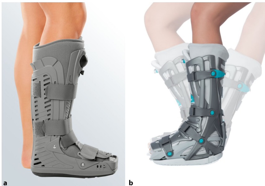
Abb. 1 ▲ a Sprunggelenkorthesen Protect CATwalker, MEDI. b Unterschenkelschiene mit limitierter Gelenkbeweglichkeit, VACOped

terbinden dabei wirkungsvoll Bewegungen in verschiedene Richtungen und stellen das Gelenk ruhig. Der Vorteil der Orthesen im Vergleich zu den Gipsruhigstellungen ist v. a. der Komfort für den Patienten, die Praktikabilität, die geringere Komplikationsrate und der Kostenaspekt, insbesondere unter dem Blickwinkel der Personalkosten.