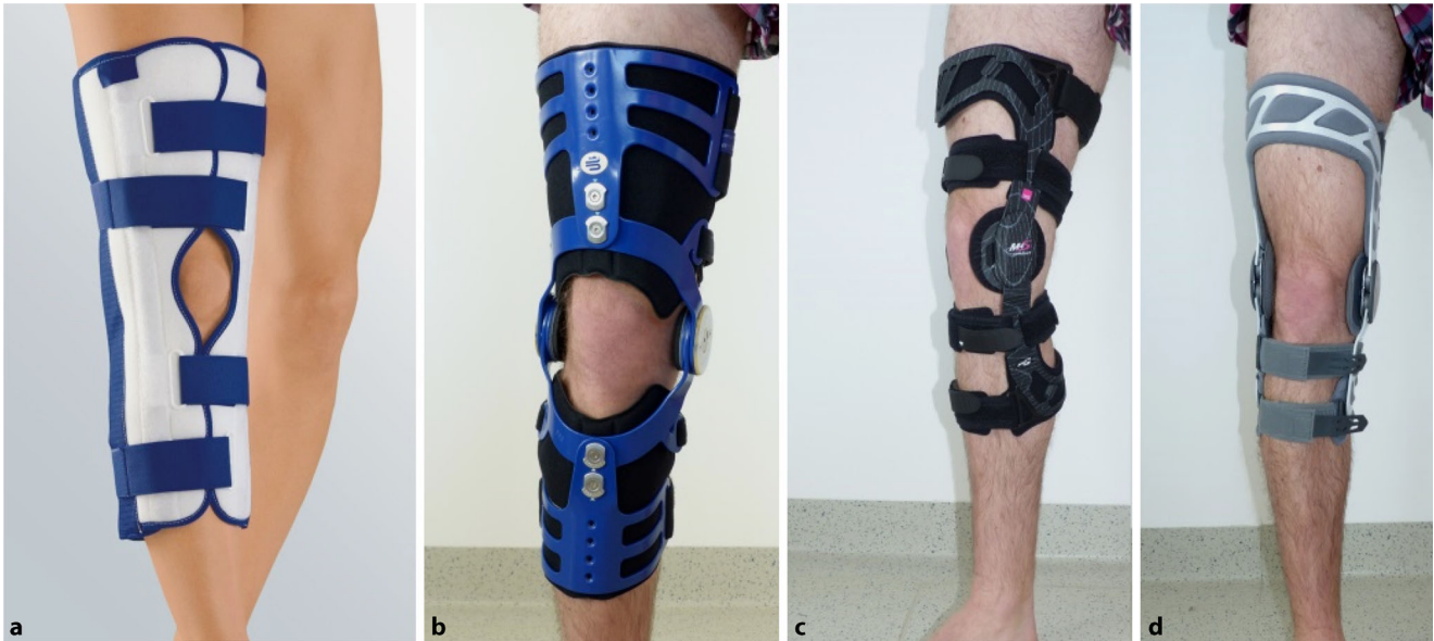
Abb. 2 ▲ Orthesen zur Stabilisierung des Kniegelenkes. a Immobilisierende Schiene (Medi Knie Ruhigstellungsschiene, mit freundl. Genehmigung MEDl; www.medi.de ), b Stabilisierungsorthese nach Umstellungsosteotomie oder komplexen Bandinstabilitäten (MOS Genu, Bauerfeind), c Führungsorthese nach Kreuz- und Seitenbandruptur (M4.s Comfort, Medi), d Gonarthrosenorthese (4 Titude OA Nano, DJO)