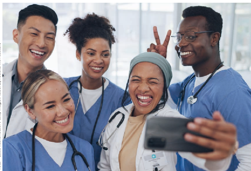
(Symbolbild mit Modellen)

Dabei sollten für neue Mitarbeitende Onboarding-Videos erstellt werden, die sowohl informativ als auch inspirierend sind. Sie sollten einen umfassenden Überblick über die jeweiligen Arbeitsbereiche bieten und Einblicke in die tägliche Arbeit und Her-