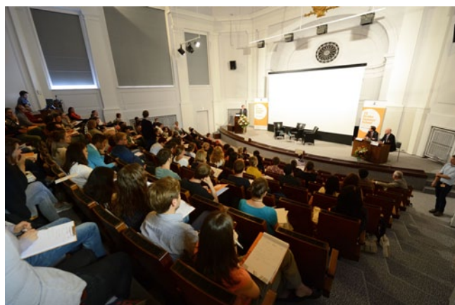
▲ 13. Stroke Summer School der Deutschen Schlaganfall-Gesellschaft in Berlin im Kaiserin Friedrich-Haus