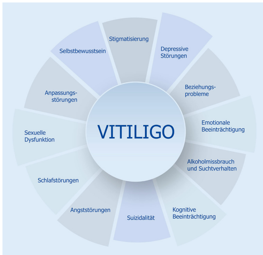
Abb. 1 ▲ In Studien ermittelte psychosoziale Problembereiche bei Vitiligo als Facetten des „disease burden“

57 % männlich; Durchschnittsalter 43 Jahre) vor. In dieser Untersuchung betrug die Prävalenz der Vitiligo 0,77 % (0,84 % bei Männern; 0,67 % bei Frauen) [49]. In einer Analyse von Sekundärdaten der gesetzlichen Krankenversicherung ( n = 1.619.678 ; 38 % männlich; Durchschnittsalter 46 Jahre) lag die (Behandlungs-)Prävalenz bei 0,17 % (0,14 % bei Männern; 0,18 % bei Frauen). Diese Diskrepanz deutet darauf hin, dass sich ein relevanter Teil der Personen mit Vitiligo nicht (mehr) in ärztlicher Behandlung befindet. Eine Erklärung dafür könnte die aus Sicht der Patienten geringen Nutzen der bisherigen Therapien sein [5]. Vitiligo war dabei signifikant häufiger bei Personen mit hellem Hauttyp, Ephe- liden und kongenitalen Nävi sowie mit einer Vielzahl weiterer Hauterkrankungen verbunden [49]. In einer weiteren vom CV-derm untersuchten bundesweiten Kohorte trat Vitiligo unter 1023 betroffenen Personen am häufigsten an den Händen (92 %), im Gesicht (87 %) und im Genitalbereich (86 %) und somit an besonders sensiblen, sichtbaren oder schambesetzten Arealen