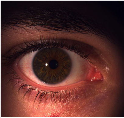
Abb. 3 ▲ Postoperativer Befund nach 1 Woche mit unauffälliger Lidkantenmorphologie und deutlicher Linderung des konjunktivalen Reizzustandes

Einschlüsse der Keratinozyten im Stratum spinosum und Stratum granulosum der Epidermis dar [1]. Der elektronenmikroskopische Virionennachweis ist ebenfalls möglich.