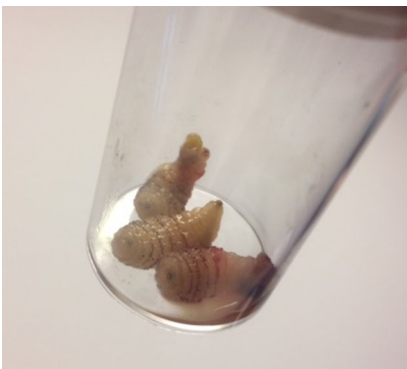
Abb. 3 ▲ Drei Dasselfliegenlarven (= Maden) nach Exkochleation im Reagenzglas

der Einsatz eines Antibiotikums erwägenswert ist. Die Therapie der Wahl ist die lokale Entfernung der Larve. In der Literatur werden neben Inzision der Höhle auch andere, kuriose therapeutische Ansätze wie die Auflage von Speck [5] beschrieben. Durch den Okklusionsverband mit einer Scheibe Schweinespeck wird die am Hinterleib sitzende Atemöffnung der Made luftdicht abgedeckt. Um an Luft zu kommen, wandert sie durch den Speck an die Oberfläche und verlässt so atraumatisch die Haut des temporären Wirts. In unserem Fall gelang es durch subkutane Unterspritzung der Larvenhöhlen mit einem Lokalanästhetikum (▣ Abb. 2a), sie durch Druck von unten durch die als Atemöffnung dienende Hautpore atraumatisch und in toto zu bergen (▣ Abb. 2b).