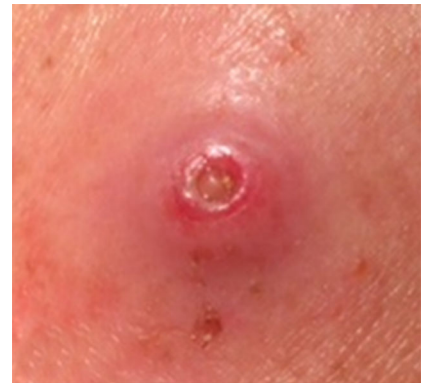
Abb. 1 ▲ Knoten mit darin befindlicher Made mit Atmungsöffnung am Hinterleib

Am linken Oberarm finden sich 3 etwa 5–10 cm voneinander entfernte Knoten. Die unmittelbare Umgebung ist sehr diskret gerötet. Nach Ablösen einer der Krusten zeigt sich im Zentrum des Knotens ein derber gelblicher Pfropf (Abb. 1). Beim Versuch, den Pfropf zu exprimieren, klagt der Patient über starke Schmerzen, sodass ein Lokalanästhetikum zur Anwendung kommt.