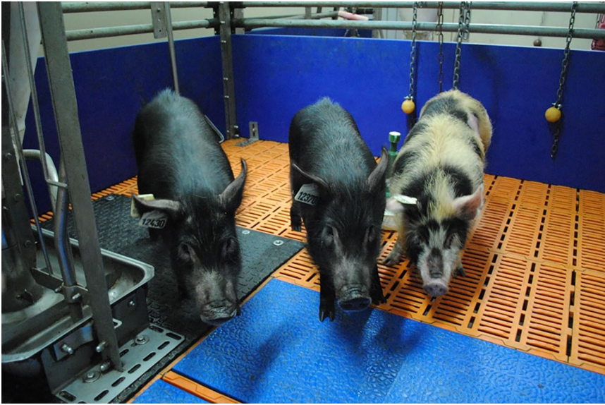
Abb. 1 ▲ Auckland Island-Schweine im Tierversuchsgut der LMU, München-Oberschleißheim.

den Menschen übertragen wird. Bei Immunsupprimierten können chronische Infektionen verursacht werden, bestehende Lebererkrankungen verschlimmern sich [43, 44].