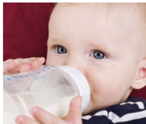
Nicht zu viel des Guten!

Arch Pediatr Adolesc Med 2011; published online Nov. 7; doi:10.1001/archpediatrics.2011.197