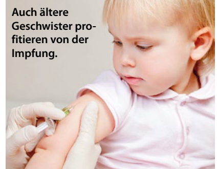
Auch ältere Geschwister profitieren von der Impfung.

Nach 2006 wurden in der amerikanischen Notaufnahme im Vergleich zu der kanadischen Klinik 34% weniger Zwei- bis Vierjährige mit influenzaähnliche Symptomen vorgestellt. Und nicht nur die Kleinkinder