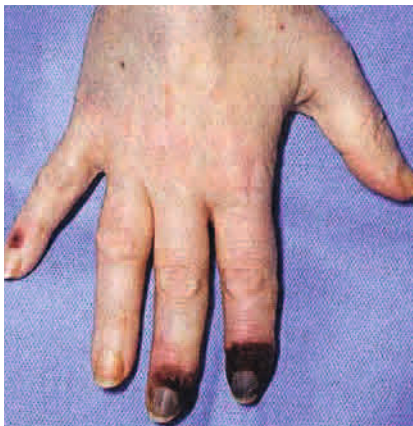
© Brit. Med. J. 340 (2010) c3102. 1368