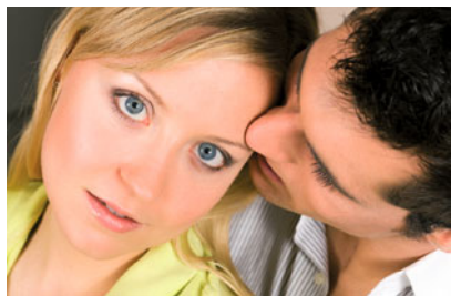
Nicht medikamentöse Schmerztherapie.