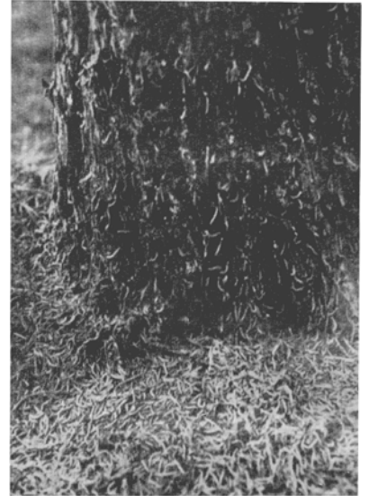
Abb. 2. Hungernde Kiefernspannerraupen am Fuße einer kahlgefressenen Kiefer. (Letzlinger-Heide 1929.)